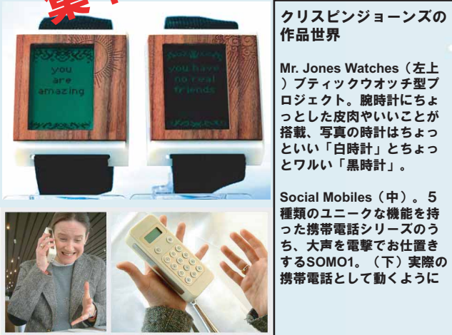
クリスピンジョーンズの作品世界

Mr. Jones Watches (左上) ブティックウオッチ型プロジェクト。腕時計にちょっとした皮肉やいいことが搭載、写真の時計はちょっといい「白時計」とちょっとワルい「黒時計」。